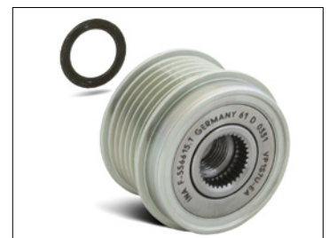
Figura 3: Per il montaggio di una ruota libera alternatore su un generatore Bosch (Ford Transit) è necessario utilizzare il distanziale incluso con spessore pari a 1,4 mm!

Osservare le indicazioni del costruttore del veicolo!