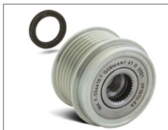
Figura 2: Per il montaggio di una ruota libera alternatore su un generatore Visteon (Ford Mondeo III) è necessario utilizzare il distanziale incluso con spessore pari a 3 mm!